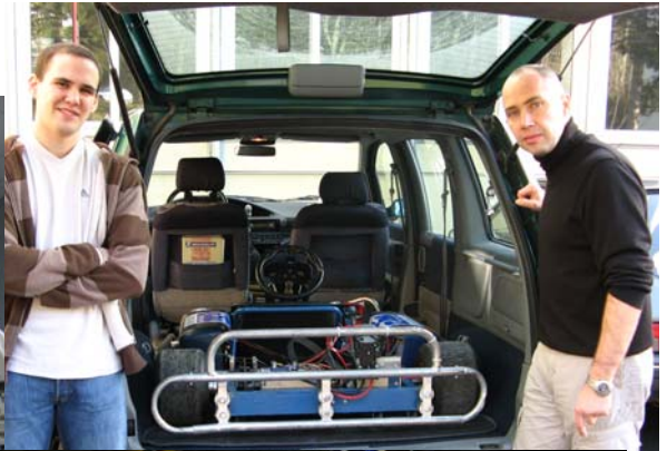
Moteur DC de type Linch 6KW